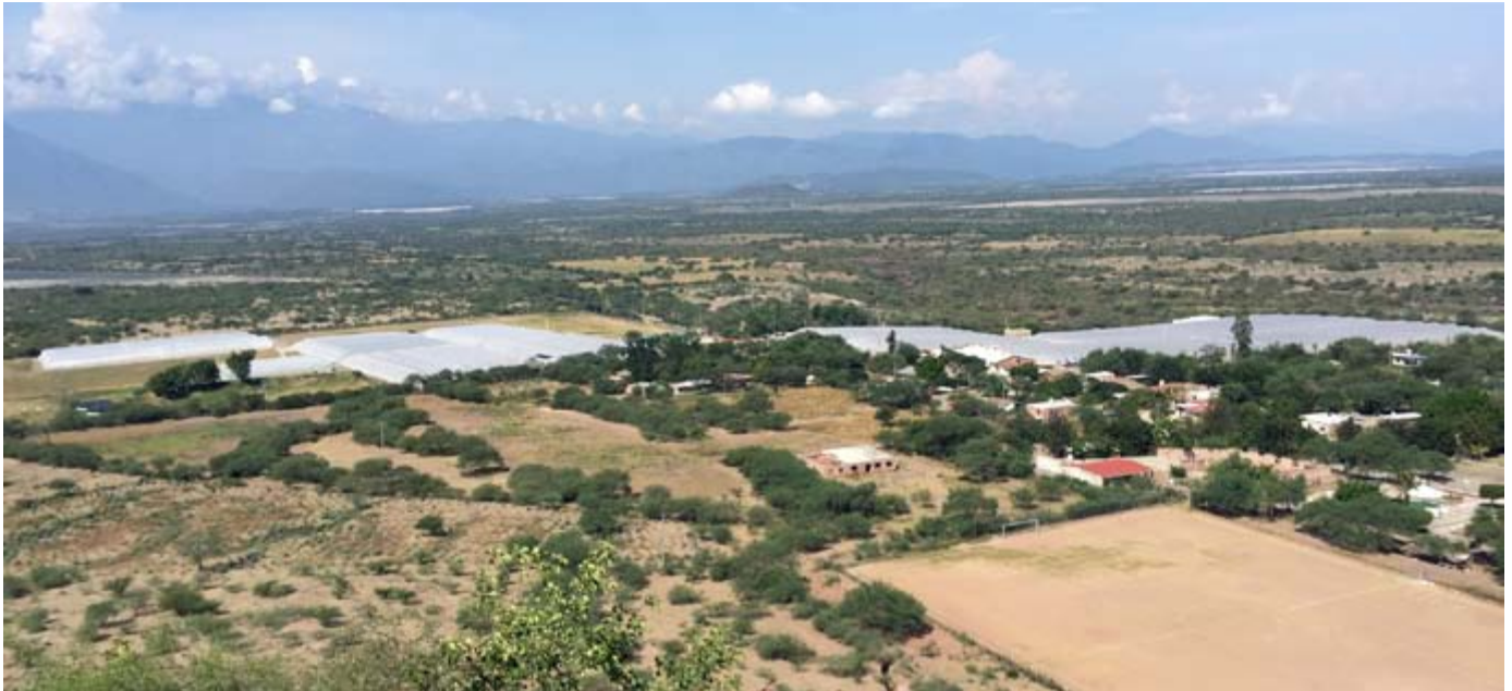
Serres Monsanto au Mexique.