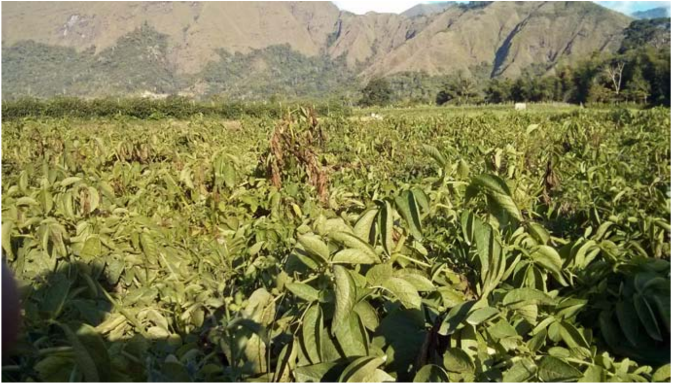
Un champ de pommes de terre Indofood à Sembalun, sur l'île de Lombok, en Indonésie, servant à l'approvisionnement d'une usine de chips.