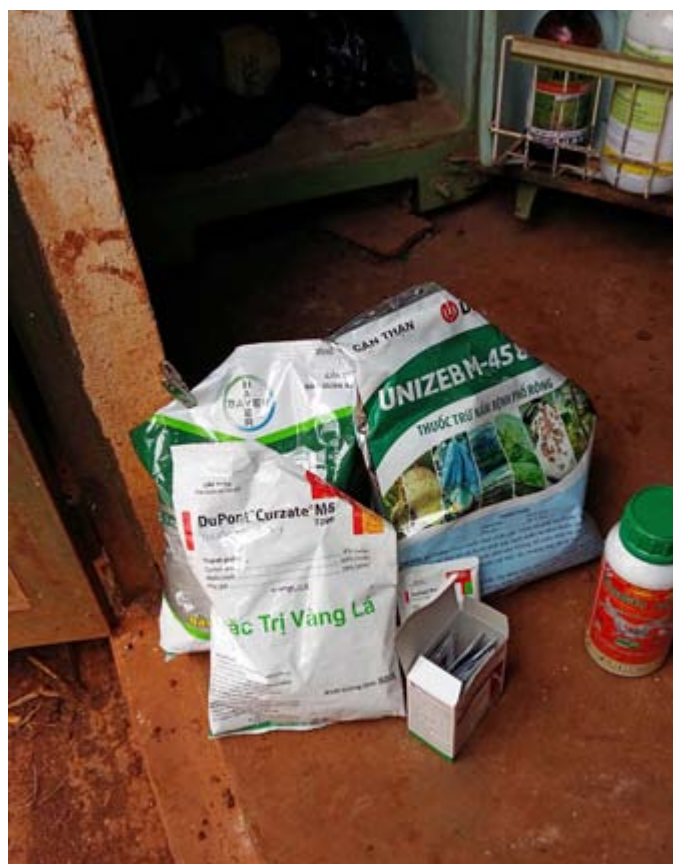
Certains des produits chimiques utilisés par M. Vinh Xuan.