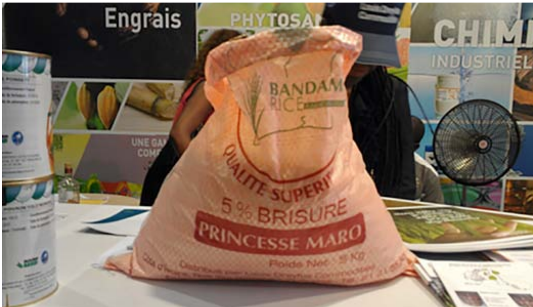
Du « riz local » lors d'une exposition sur le riz en Côte d'Ivoire.

conseille simplement ses membres et les invite à agir de façon responsable et à faire appel à la participation de certaines ONG et groupes d'agriculteurs. Grow Asie, par exemple, dispose d'un Conseil de la société civile qui « joue un rôle de conseil pour permettre des retombées sociales et environnementales positives », mais n'a aucune autorité en matière de respect de la conformité. 23