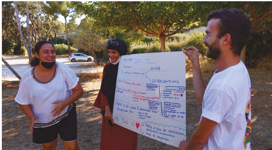
Proposition par les anciens-ne-s volontaires de nouveaux projets à mettre en œuvre au sein d'Eurasia net.

Lors de cette expérimentation, le choix a été fait d' insister sur l'aspect "réalisable" des projets, principalement en fonction du temps que les jeunes souhaitent investir dans cet engagement pour ne pas se lancer sur des projets qu'ils-elles ne seraient pas en capacité de réaliser.