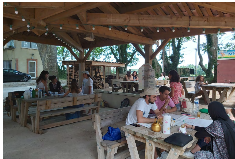
Temps de réflexion et brainstorming lors du 1er week-end à Salon de Provence.

1) Autour de ces trois grandes thématiques, imaginer dans un premier temps ses objectifs idéaux, même si un peu éloignés de la réalité des ressources d'Eurasia net, afin dans de se donner toutes les perspectives possibles ; 2) Réfléchir collectivement aux possibilités de faire coïncider ces objectifs idéaux avec les moyens réels dont dispose Eurasia net : Faire un état des lieux, un peu plus technique de l'association, revaloriser le capital, et les capacités de l'association en étant pragmatiques et réalistes, redéfinir les moyens et ressources à disposition : humains (compétences), financiers, physiques, les dispositifs et le "capital expériences" en volontariat/ innovation sociale. 3) Passer du concept à l'opérationnel, matcher les moyens avec les aspirations en s'ouvrant à de nouvelles possibilités. En bref : "comment on peut atteindre ce qu'on a identifié comme important dans le brainstorm avec les moyens dont on dispose ? Sinon, de quels moyens doit-on se doter pour y parvenir ?"