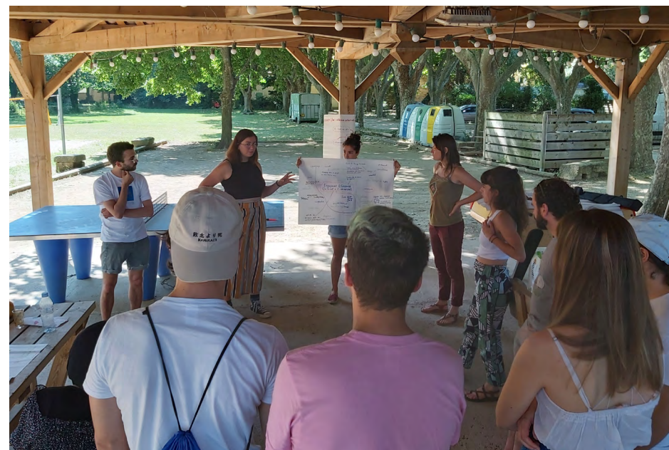
Temps de restitution du brainstorming entre les ancien-ne-s volontaires d'Eurasia net.