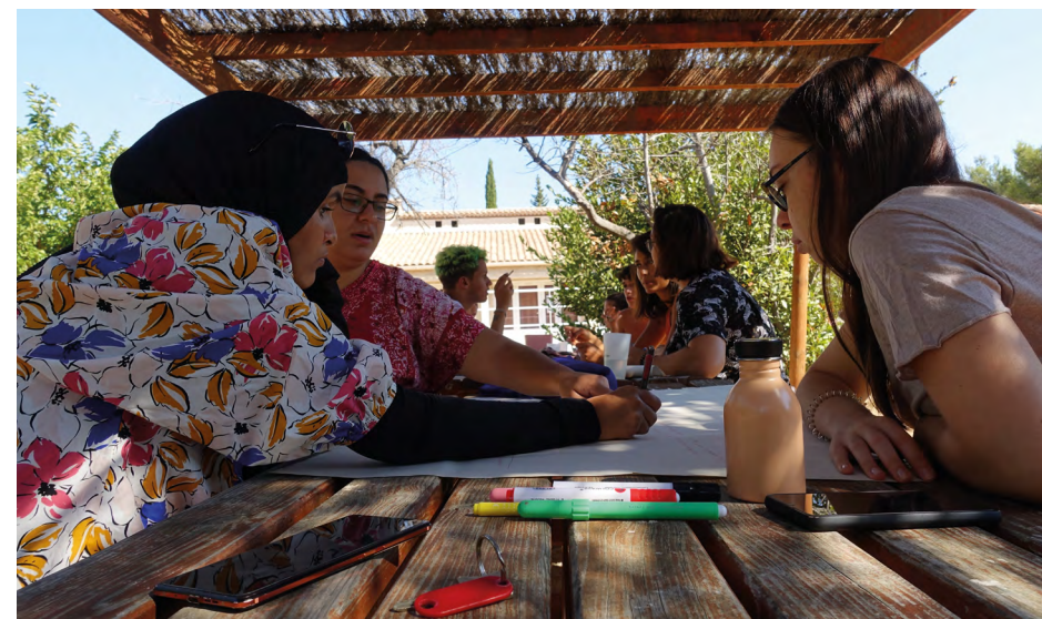
Temps de réflexion collectif sur le développement de nouveaux projets au sein d'Eurasia net.

Le-la jeune s'implique ainsi pour préparer et animer le séjour, apprend à travailler en équipe, développe des compétences organisationnelles et retrouve un environnement international avec les partenaires YMCA.