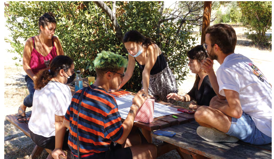
Temps de brainstorming sur l'engagement des jeunes à Eurasia net.

Au regard des réponses obtenues, établir les points forts et points faibles de l'association et de l'environnement dans laquelle elle évolue.