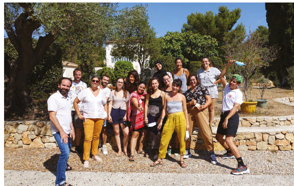
Photo de groupe à la fin du second week-end organisé par YMCA et Eurasia net.

Si l'engagement des jeunes est favorisé par la montée de projets qui lui tiennent à cœur, il est important que la structure puisse offrir tous les moyens de sa mise en œuvre , donc vérifier que celui-ci correspond bien aux ambitions et moyens de la structure encadrante au risque que les projets n'aboutissent pas ce qui décourageraient les jeunes qui s'engagent.