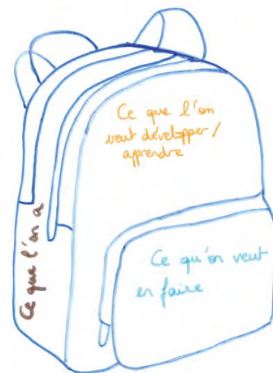
Le sac à dos comme outil de retour d'expérience pour les ancien-ne-s volontaires internationaux.

l'existant ou son développement mais aussi pour évaluer les actions et la motivation des jeunes. Cela permet alors à l'association de s'assurer qu'elle répond aux objectifs des jeunes et qu'elle leur laisse une place suffisante. Il semble alors important que la structure puisse écouter les retours de ces jeunes et puisse s'adapter en conséquence.