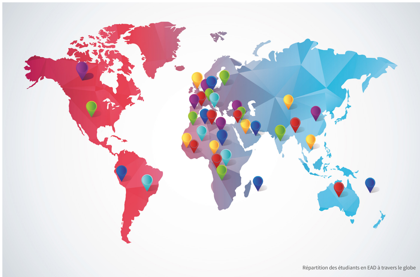
Répartition des étudiants en EAD à travers le globe