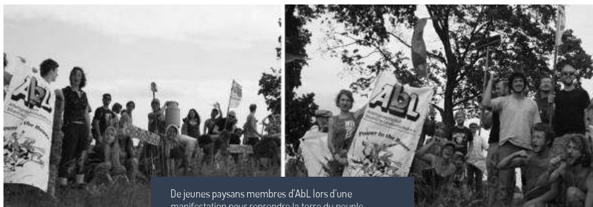
De jeunes paysans membres d'AbL lors d'une manifestation pour reprendre la terre du peuple

La concentration des terres entre les mains d'investisseurs et d'entreprise a causé la dépopulation de villages, le déclin des infrastructures et la disparition de cultures locales dans les régions rurales d'Allemagne de l'Est.