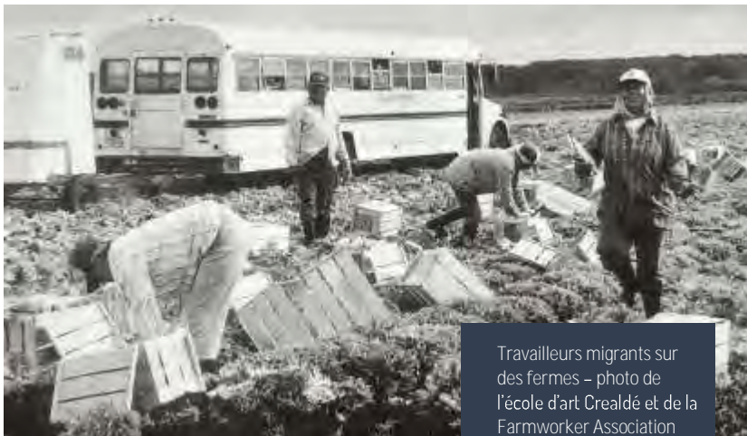
Travailleurs migrants sur des fermes

Il s'agirait notamment d'intégrer et d'appliquer les concepts de souveraineté alimentaire, de redonner le pouvoir aux gens et à leurs communautés et d'adopter les principes d'agroécologie. Le Gardens Project de la FWAF est un effort dans ce sens qui vise non seulement à offrir à nos