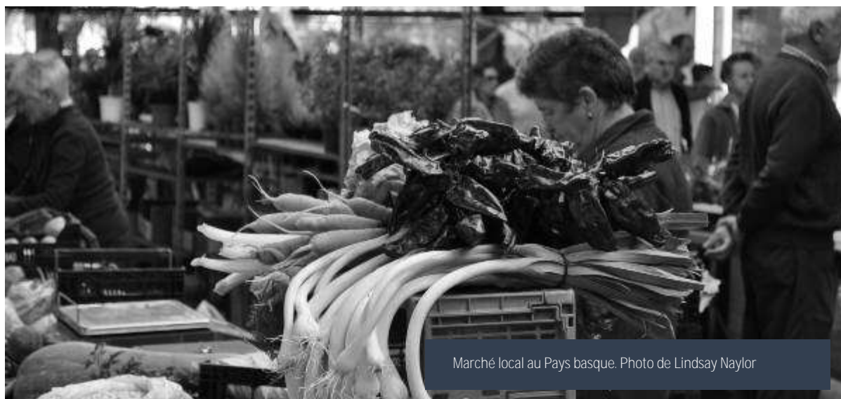
Marché local au Pays basque.

D'une part, bien que la paysannerie considère encore que la vente locale est un de ses principaux canaux de vente, des facteurs comme la privatisation de la gestion, les conditions disparates d'accès à cette vente qui ne répondent pas aux besoins de l'industrie et l'approche de supervision nuisent au développement de son plein potentiel à de multiples niveaux au lieu de favoriser la gouvernance participative qui a toujours caractérisé ces espaces. Cela touche tout particulièrement les femmes qui ont traditionnellement joué un rôle de premier plan dans les ventes locales.