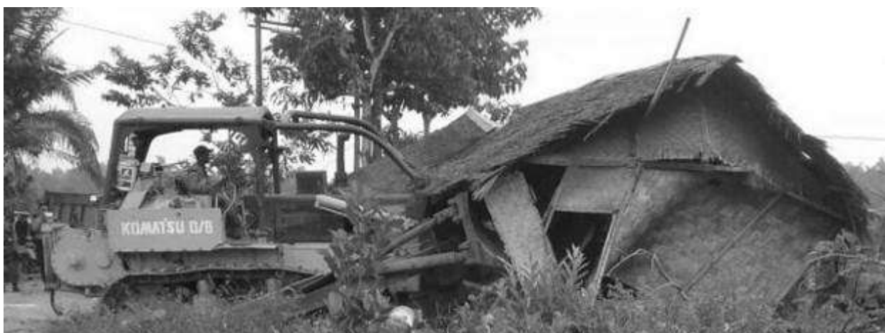
Scènes du village de Mekar Jaya où plusieurs maisons de paysans ont été rasées avec l'aide de la police pour faire place à la plantation d'un agrobusiness

LNK et PTPN II voulaient expulser ces familles pour s'emparer de 554 hectares pour la culture de la palme à huile.