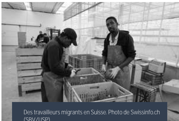
Des travailleurs migrants en Suisse.

Rien de cela n'est nouveau. Cela fait partie d'un processus en cours depuis des siècles, mais qui s'accélère maintenant. Très peu de pays se sont dotés de politiques qui incluent, par exemple, un appui important et pourtant essentiel à l'agriculture paysanne et/ou des programmes de redistribution des terres!