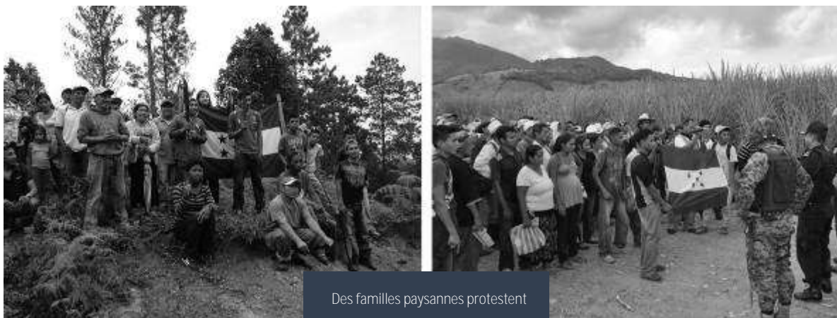
Des familles paysannes protestent

Tout particulièrement, la municipalité de San Pedro de Tutule présente un déficit élevé au chapitre de l'accès à la terre pour les familles paysannes. Parmi les familles qui travaillent la terre, «42 % possèdent leurs propres terres, 52 % ne possèdent pas de terres, 2,91 % occupent des terres contestées, 0,81 % partagent des terres communales, 0,65 % travaillent sur des terres prêtées et 0,24 % louent des terres 22 .» Cette mise en contexte explique le besoin criant d'un pourcentage élevé de la population paysanne de cette municipalité et tout particulièrement du camp paysan «9 de julio,» dont les membres affirment «vivre dans la pauvreté, manquer de travail et d'habitation et avoir besoin d'aliments» (Wilman Chávez, dirigeant du camp paysan).