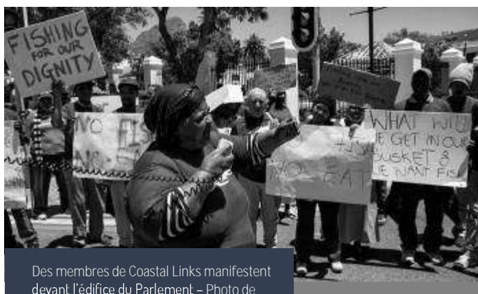
Des membres de Coastal Links manifestent devant l'édifice du Parlement

Auparavant, la mer était entièrement ouverte aux petits pêcheurs. Avec la nouvelle loi, tous les pêcheurs devaient présenter une demande de permis de pêche. Dans le passé, seuls les amateurs étaient tenus d'obtenir un permis de pêche récréative à un bureau de la poste sud-africaine. Les grandes et petites entreprises de pêche demandaient des quotas de pêche alors que les petits pêcheurs artisanaux avaient le droit de pêcher pour subvenir à leurs besoins. Mais tout a changé en 2005 lorsque la MLRA de 1998 a été appliquée.