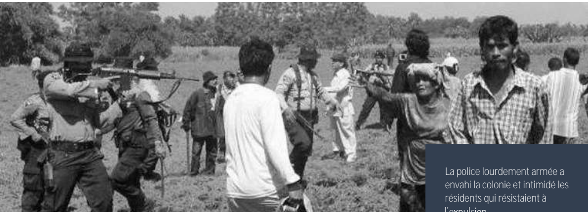
La police lourdement armée a envahi la colonie et intimidé les résidents qui résistaient à l'expulsion

Après des manifestations incessantes, le 23 novembre 2016, des représentants du bureau présidentiel (KSP) ont visité le secteur et ordonné la suspension temporaire de l'éviction. Les routes vers le village de Mekar Jaya ont été rouvertes. Une médiation entre les paysans et des représentants de la société ont eu lieu en présence du KSP et du chef de la Commission A du parlement de Sumatra du Nord et de dirigeants de l'Agence foncière nationale et du district. Les parties se sont entendues sur la suspension de l'éviction et le rétablissement du service d'électricité pour les résidents. Cependant, le calme n'a pas duré longtemps.