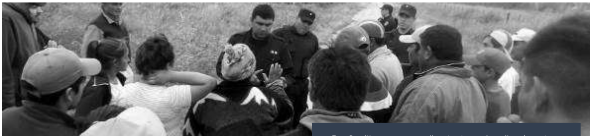
Des familles paysannes discutent avec la police durant une manifestation.

La communauté IACU-CACHI se trouve à 80 km de la ville de Quimili sur la route provinciale N° 116 dans la zone du Bajo Hondo du département de Juan Felipe Ibarra, province de Santiago del Estero, au nord-ouest de l'Argentine, à seulement quelques kilomètres des provinces de Chaco et de Santa Fe. Depuis 2011, la communauté de Bajo Hondo mène une démarche pour qu'Iacu Cachi soit reconnue communauté autochtone de la nation Guaycurú. Il s'agit d'une communauté de base du mouvement paysan Santiago del Estero – MOCASE Vía Campesina, un membre de la CLOC – La Via Campesina.