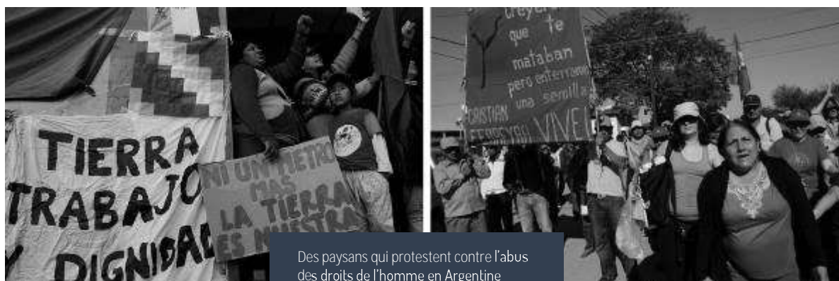
Des paysans qui protestent contre l'abus des droits de l'homme en Argentine

Argenceres est une société privée appartenant au Groupe Porchitol formé de capital espagnol. Depuis des années, Argenceres tente de chasser les familles de leurs terres à Jocolí Norte afin d'accaparer ces terres à l'aide de faux titres fonciers. Un secteur du pouvoir judiciaire et les forces de police sont complices de leur projet. La communauté villageoise produit pour les marchés local et national alors qu'Argenceres ne s'intéresse qu'à l'agriculture d'exportation. Cette même société a perforé des puits profonds qui ont perturbé le bassin versant et coupé l'accès à l'eau des communautés en aval.