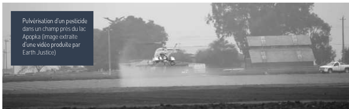
Pulvérisation d'un pesticide dans un champ près du lac Apopka

Dr Louis Guillette, chercheur à l'University de Florida, mena des études sur les alligators du lac Apopka à partir du milieu des années 1980. Il a rapidement découvert des anomalies dans la reproduction des alligators qu'il a par la suite attribuées à la contamination aux pesticides organochlorés liée aux pesticides provenant des fermes de la rive nord du lac.