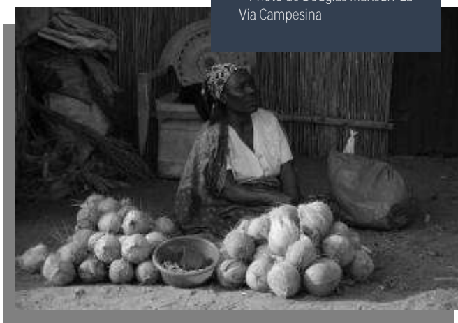
Un marché local au Mozambique