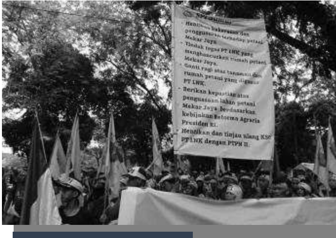
Membres de Serikat Petani Indonesia, le syndicat paysan indonésien durant une manifestation

Les paysans de Mekar Jaya pratiquent des formes d'agriculture traditionnelle dans la région centrées sur de multiples cultures à différents moments de l'année basées sur la sagesse transmise par les générations antérieures. Ils produisaient des cultures vivrières, des fruits et du bois pour répondre à leurs besoins locaux. Au cours de l'expulsion, 138 ha de caoutchouc, 3 ha de plantes maraîchères, 2 ha de bananiers, 1 ha de jengkol , 3 ha de galanga , 2 ha de cacao, 2 ha de