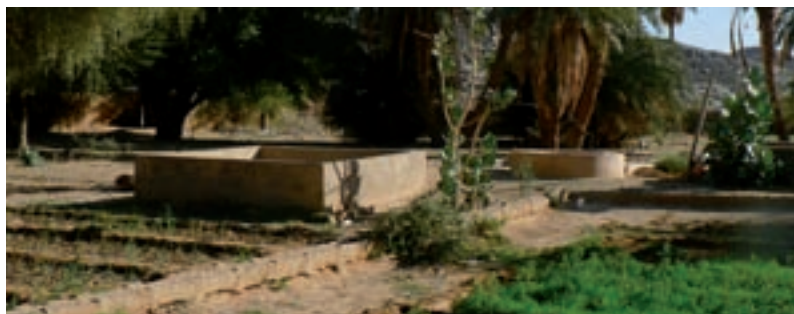
Jardins, Nord Mali, © Cari

Les points de vigilance concernent la difficulté d'associer l'ensemble des parties prenantes dans les démarches de gestion de l'espace, ainsi que d'intégrer les espaces non cultivés, exploités pour le bois de feu et la vaine pâture.