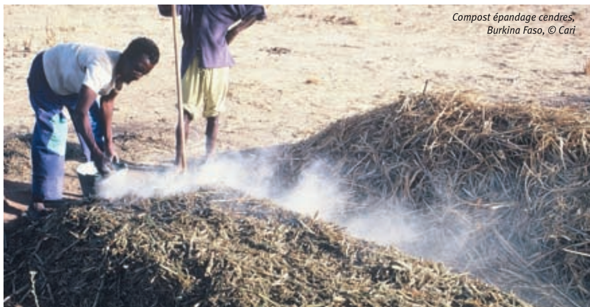
Compost épandage cendres, Burkina Faso

Toutefois, il faut noter que la valorisation des savoirs locaux repose sur une évaluation in situ des techniques. Ces techniques ne seront appropriées que si les bénéfices sont visibles sur le court et le moyen termes (voir le thème « méthodologie »).