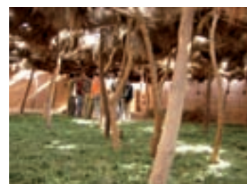
Sechage henne bio, Maroc

Attention toutefois : les modifications des dispositions foncières se heurtent à de nombreux obstacles sociologiques et politiques. L'augmentation de la productivité du travail la plus immédiatement appréciable est une amélioration de la sécurité alimentaire. Au-delà de ce seuil, les considérations impliquent certainement d'autres paramètres, les revenus monétaires en particulier. Si une partie des intrants peut faire l'objet de substitutions localisées à l'échelle des projets, l'organisation des marchés pour une échelle plus vaste reste posée.