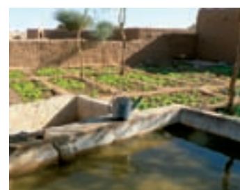
Jardins, Mali, 2009