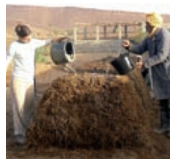
Arrosage Compost, Maroc, 2008

Dans ces trois cas, les paysans ont été désignés par leurs pairs pour participer aux travaux : ils sont des « paysans expérimentateurs ». Ils sont certes « innovateurs », mais, contrairement à certaines pratiques de vulgarisation, il ne s'agit pas d'abord d'aventures individuelles. Dans des contextes différents, les Ceta 57 ont joué en France un rôle important dans l'évolution de l'agriculture après la deuxième guerre mondiale.