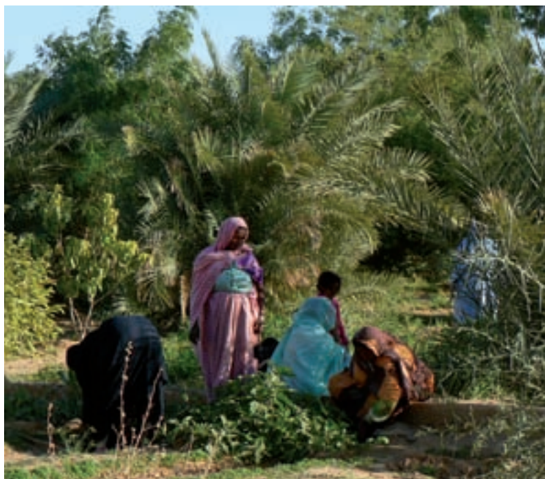
Jardins, Nord Mali

Le « grand absent » des projets reste l'espace non cultivé, qui coïncide avec l'espace non cultivable quand la densité rurale est élevée. Cet espace ne fait l'objet d'aucune attention particulière. Il s'agit des « parcours » où s'exerce une pression exponentielle sur la végétation (bois de feu et vaine pâture) ; on y observe fréquemment des dégâts importants, voire catastrophiques. C'est dans ces espaces que se déroule une grande part des processus de désertification, de dégradation et de dénudation des sols, et donc de ruissellement et d'érosion pendant la saison des pluies. Or dans les paysages des zones sahéliennes et au Nordeste brésilien, l'espace non cultivé représente une proportion importante des espaces ruraux. Ce point mérite une attention particulière.