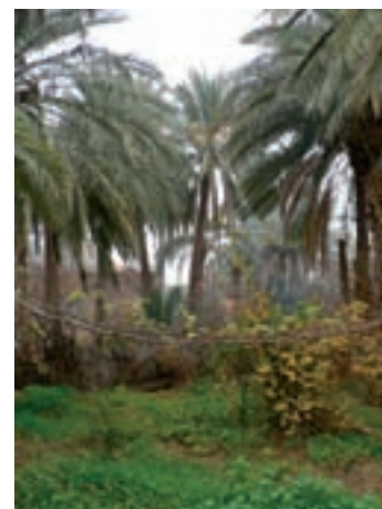
Beni Isguen, Algérie

Afin de garantir sa pérennité et son développement, un projet d'agroécologie doit s'inscrire dans une trajectoire et une vision globale des enjeux du territoire. Il s'agit de prendre de la hauteur par rapport à la seule dimension individuelle pouvant être à l'origine du projet. souvent, cette dimension individuelle n'est pas suffisante pour mettre en perspective l'ensemble des actions menées et les développer de manière progressive et cohérente. Une logique de territoire permet de structurer cette approche. Elle permet d'articuler les actions menées en fonction des besoins et enjeux plus globaux du territoire. En général, la concurrence sur l'usage des espaces et des biens communs est à intégrer de manière transversale.