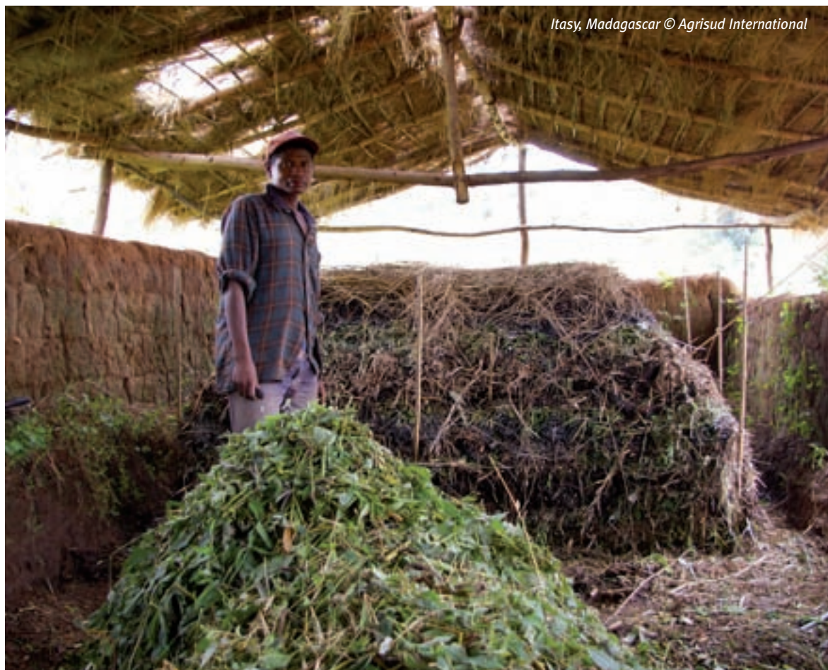
Itasy, Madagascar

Les produits agroécologiques devraient donc bénéficier de marchés spécifiques (« de niche ») comme c'est le cas dans le Nordeste brésilien avec les chaînes de marchés locaux solidaires « Xique xique ». En Europe, les produits « bio » s'écoulent dans des filières bénéficiant d'une labellisation et des circuits spécialisés, cependant, l'organisation de tels marchés est le fait d'organisations professionnelles fortes et structurées susceptibles d'interpeller les pouvoirs publics.