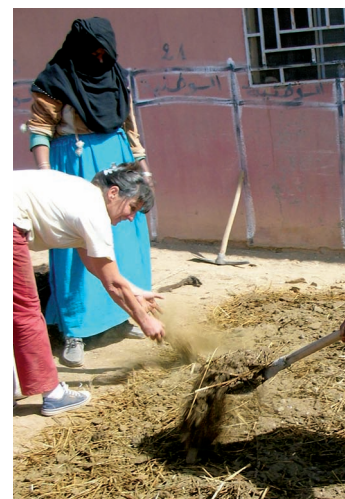
Compostage, Maroc, 2008