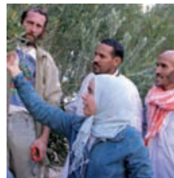
Echanges d'expériences, Maroc, 2008