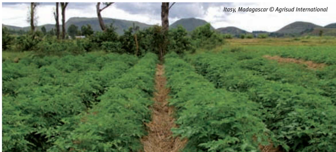
Itasy, Madagascar

Il faut insister sur le fait que toute démarche doit être précédée d'un diagnostic le plus complet possible et partagé par les acteurs du territoire. La vision globale doit anticiper les changements à court, moyen et long termes dans le territoire et pour les acteurs concernés. Toutefois, les méthodes d'une approche holistique mériteraient d'être mieux formalisées. Ses impacts sont complexes à évaluer si on doit prendre en compte les bénéfices directs et induits.