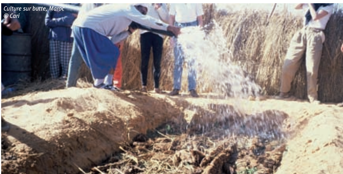
Culture sur butte, Maroc © Cari