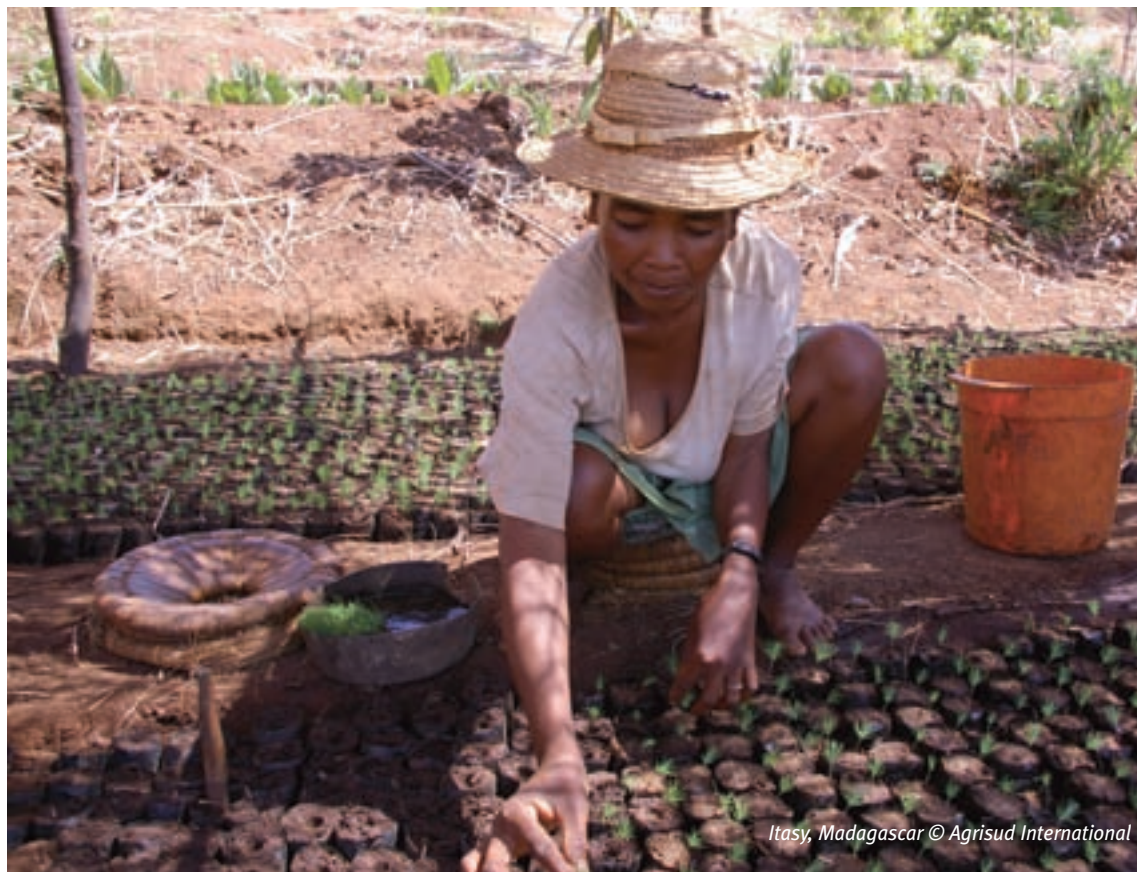
Itasy, Madagascar

En définitif, on peut retenir que dans le Nordeste brésilien, la volonté de réduire l'utilisation des intrants chimiques est une composante forte du développement des pratiques agroécologiques. Cependant, si peu de projets mettent en avant des impacts sanitaires bénéfiques de l'agroécologie, c'est (probablement) par méconnaissance des risques liés à l'usage de pesticides pour plusieurs cultures, dont les cultures maraîchères.