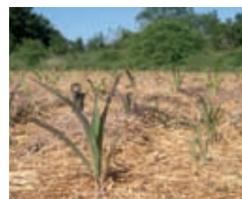
Paillage sur champs, Mas de Londres, France