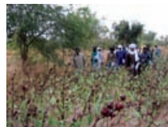
Formation Agroécologie, Burkina Faso, 2007

Cependant, il est difficile aujourd'hui de transmettre aux collectivités concernées des évaluations précises des bénéfices induits. En effet, elles sont parfois déconnectées des critères d'évaluation proposés par les financeurs ou les politiques nationales ou internationales. En plus, il manque parfois des ressources humaines et financières aux porteurs de projet pour mener à bien la démarche.