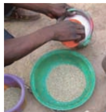
Mali © Gcoza