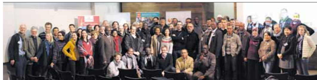
Une partie des 105 participants présents lors de l'atelier à Nogent-sur-Marne, sur le campus du Jardin d'Agronomie Tropicale de Paris, les 14 et 15 décembre 2017.

Actes de l'atelier d'échanges et construction méthodologique des 14 et 15 Décembre 2017